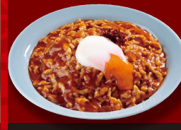
辛味あんかけ 炒飯 +温玉 1,030円