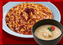
辛味あんかけ 炒飯 爆安ッ! 250円! 「豚骨」 +半ラーメン 1,180円