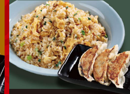
広東 炒飯 +餃子 1,080円