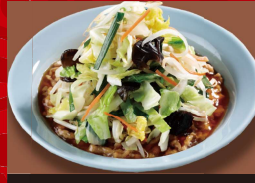
肉あんかけ 炒飯 +野菜 1,030円