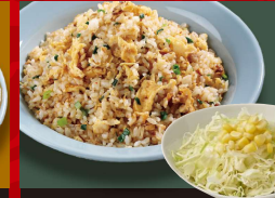
広東 炒飯 +サラダ 1,060円