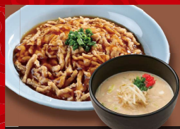
肉あんかけ 炒飯 爆安ッ! 250円! 「豚骨」 +半ラーメン 1,080円