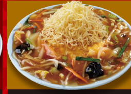
天津 炒飯 +チーズ 1,050円