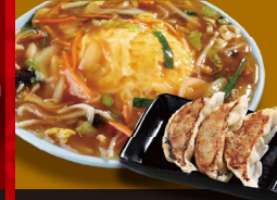
天津 炒飯 +餃子 1,050円