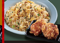
広東 炒飯 +から揚げ 1,180円