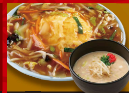
天津 炒飯 爆安ッ! 250円! 「豚骨」 +半ラーメン 1,100円