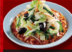
辛味あんかけ 炒飯 +野菜 1,130円