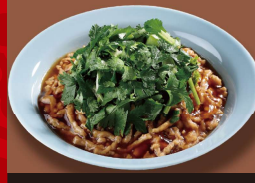
肉あんかけ 炒飯 +パクチー 1,080円