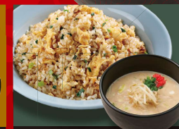
広東 炒飯 爆安ッ! 250円! 「豚骨」 +半ラーメン 1,130円