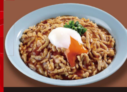
肉あんかけ 炒飯 +温玉 930円