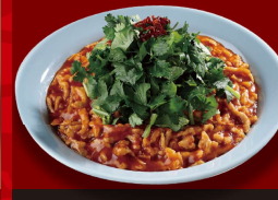
辛味あんかけ 炒飯 +パクチー 1,180円