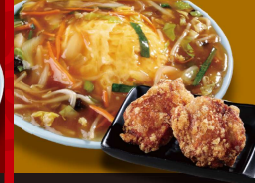
天津 炒飯 +から揚げ 1,150円